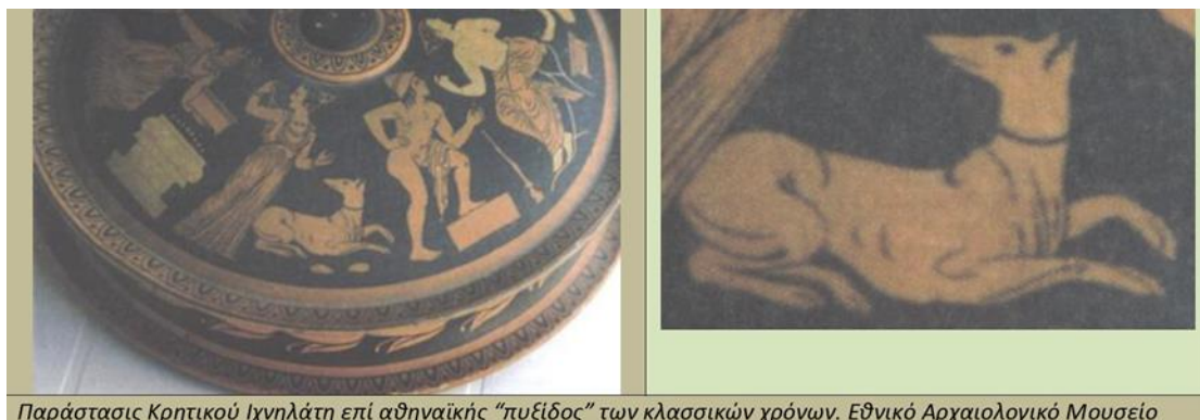
Παράστασις Κρητικού Ιχνηλάτη επί αθηναϊκής "πυξίδος" των κλασσικών χρόνων. Εθνικό Αρχαιολογικό Μουσείο

βιοτικές συνθήκες και έχουν περάσει χιλιετίες, υπάρχουν σημαντικά κοινά σημεία όπως γενική μορφολογική εμφάνιση, οξύληκτο ρύγχος, μαύρο ακρορρίνιο, παρόμοια σκέλη, κυρίως όρθια αυτιά και προπάντων κουλουριασμένη ουρά.